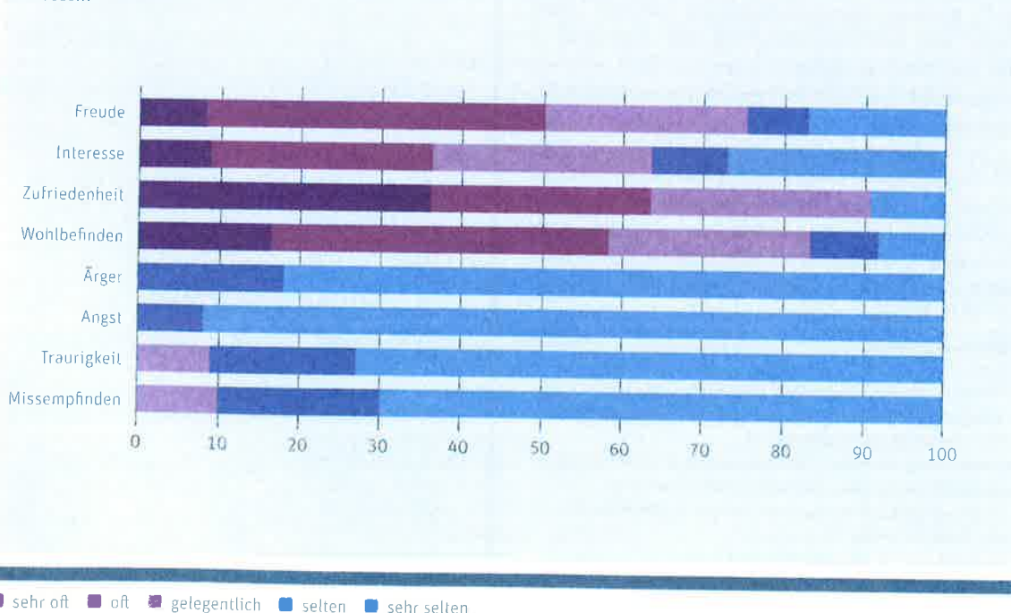
Abbildung 3: Während der Techniknutzung von den Angehörigen beobachtete Emotionen zum ersten Untersuchungszeitpunkt in Prozent

Die Angehörigen bewerten das Technikangebot zur sensorischen Stimulation überwiegend positiv. Wie häufig sie das Angebot zusammen mit den Bewohnenden nutzen, hängt stark vom Gesundheitszustand und der Mobilität der Personen ab. Sind die Bewohnenden mobil und gesundheitlich dazu in der Lage, verlassen die Angehörigen bei ihren Besuchen zusammen mit den Bewohnerinnen und Bewohnern häufig das Haus, gehen auf Spaziergänge im hauseigenen Garten oder ausserhalb und machen Ausflüge.